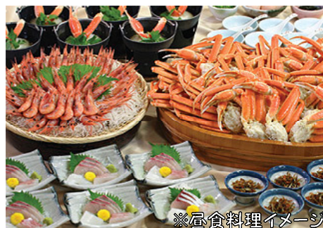
※昼食料理イメージ

愛知12区各地7:00~8:00=各IC=東名高速・名神高速・北陸道 (途中休憩)=敦賀IC=昆布館(休憩)=敦賀国一宮・気比神宮(参拝) =越前海岸(カニ脚と甘エビ60分食べ放題)=日本海さかな街 (海産物店・買物)=小牧かまぼこ(休憩)=北陸道・名神高速・ 東名高速(途中休憩)=各IC=18:30~19:00頃 愛知12区各地